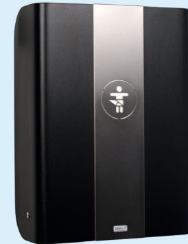
KAWAmaxi & KAWAmidi